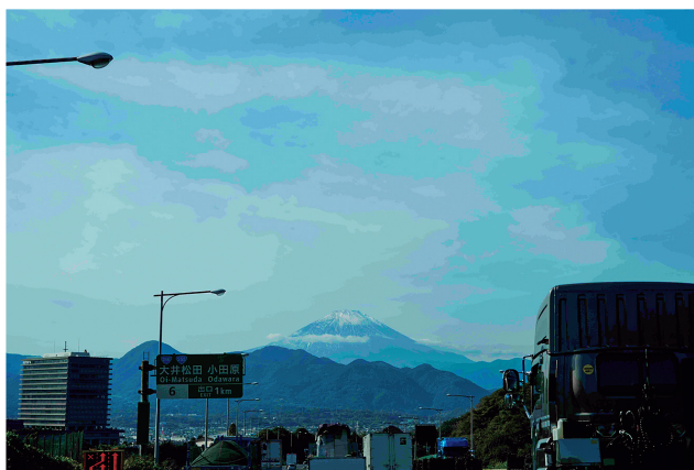
東名大井松田 IC 付近から富士山を望む