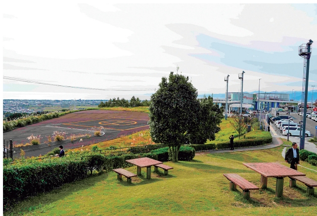
駿河沼津 SA 併設の防災ヘリポート