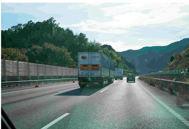
ダブル連結トラック走行状況