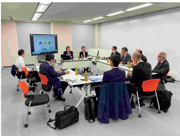
11月17日(金)、中日本高速(株)にてヒアリング