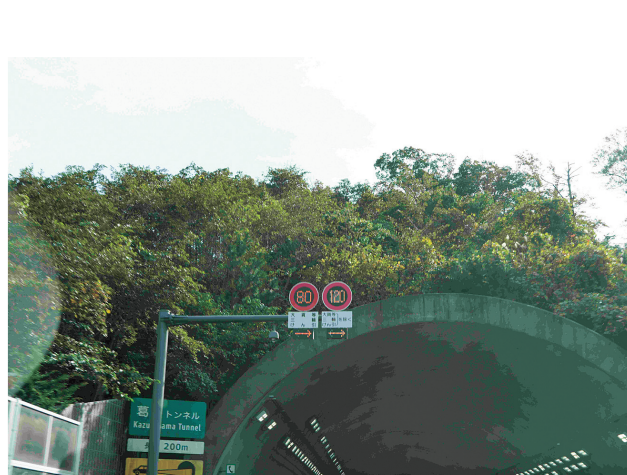
120 キロ規制標示(大型 80 キロ)