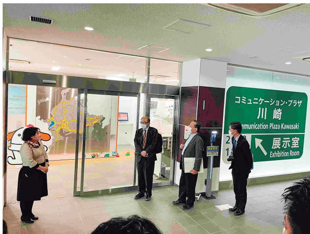
11 月 16 日(木)、まずは管制センター併設広報施設訪問

開催日：2023 年(令和 5 年)11 月 15 日(水)～11 月 17 日(金)