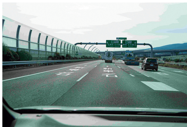
東名高速から新東名高速へ(御殿場 JCT 付近)