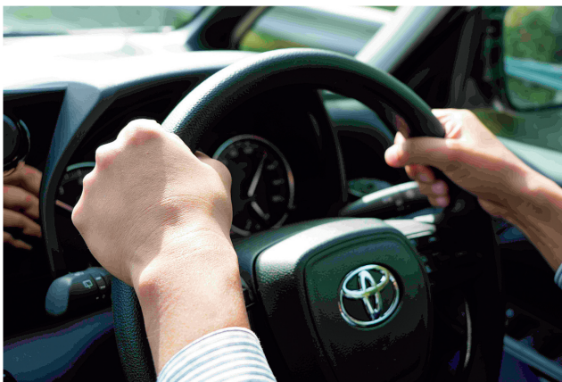
緊張のステアリング