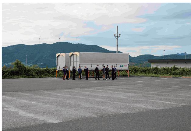
浜松 SA 併設のコネクトエリア見学