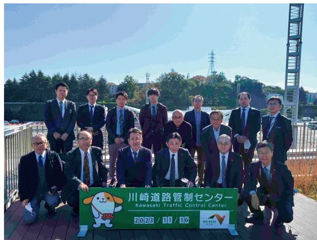
参加者一同(管制センター屋上にて)