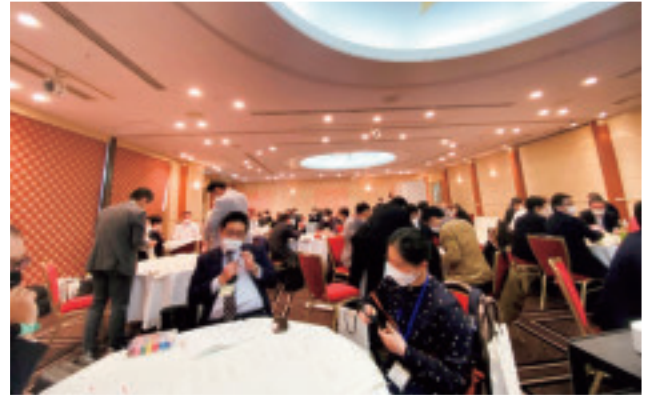
ワークショップ時の会場の様子 (久しぶりに対面で交流できました)