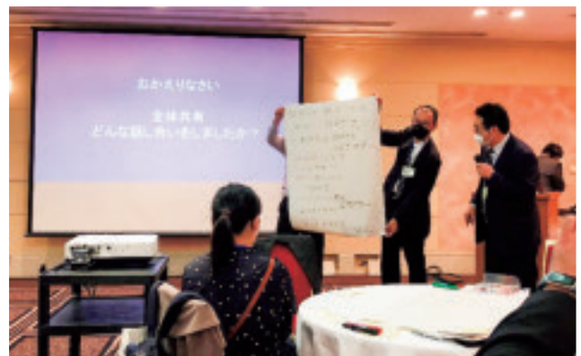
議論内容を全体へ共有 (様々な意見が出て、多くの刺激を頂きました！)