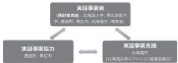
図-5 検討委員会による地域との連携体制