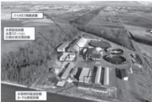
図-7 しかおい水素ファーム全体配置図

の鹿追町環境保全センターの中に新たな施設を追加整備して、稼動しています(図-7 参照)。