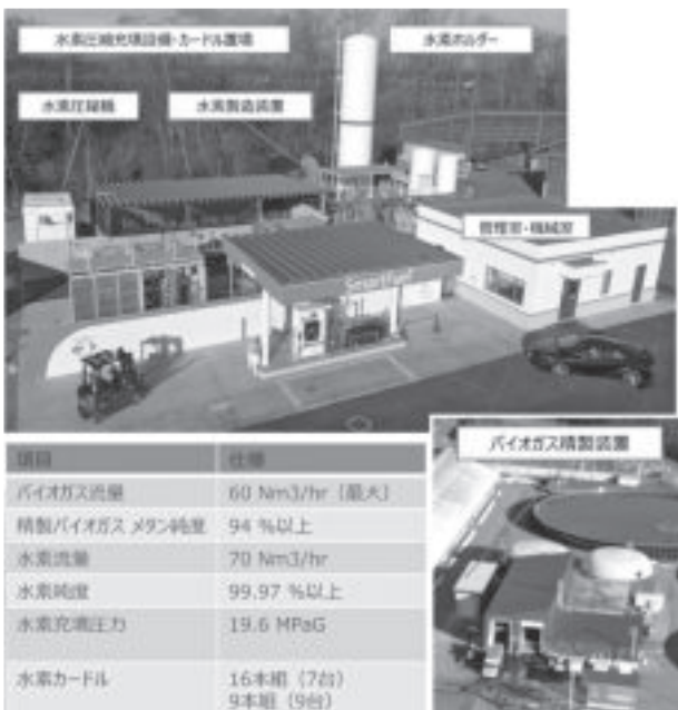
図-8 しかおい水素ファーム設備配置概要図

本センターの広い敷地内には、バイオガス精製装置(バイオガス流量 60Nm 3 /h、メタン純度 94%以上)、水素製造装置(水素流量 70Nm 3 /h、水素純度 99.97%)、水素ステーション(水素供給能力 100Nm 3 /h 以上、70MPa/35MPa)、圧縮水素充填設備(19.6MPaG、カードル 16 本組×7 基、9 本組×9 基)、水素燃料電池設備(700W 出力×2 基)、カードル保管設備(16 本組×2 基)が配置されています(図-8 参照)。