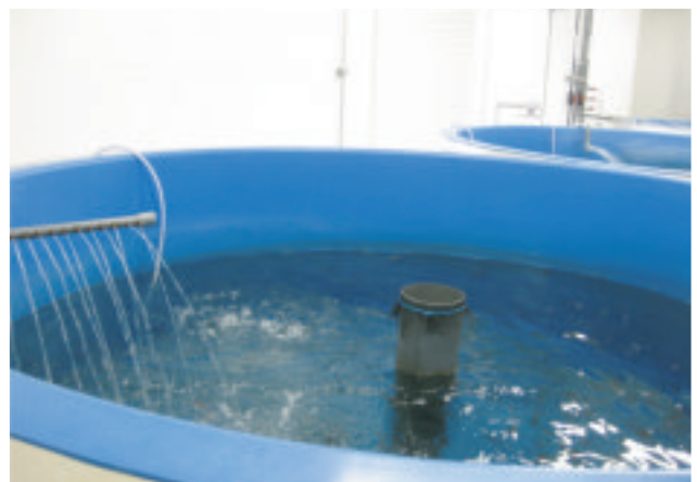
余剰熱を使ったチョウザメの蓄養施設