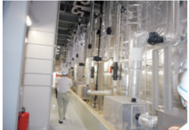
南早来大型蓄電システム内部の見学状況