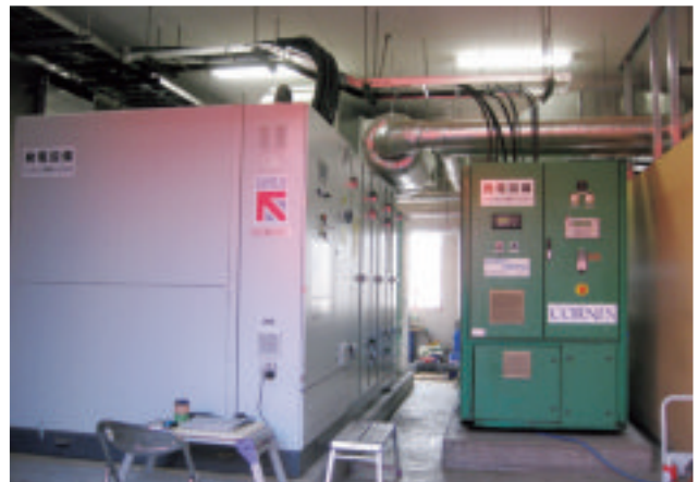
鹿追町環境保全センターのバイオガス発電設備