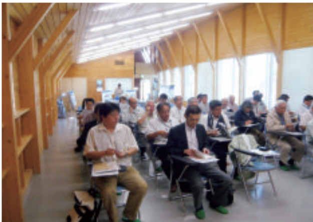
鹿追町環境保全センター研修棟で説明を聞く参加者