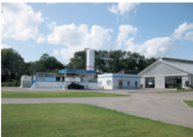
鹿追水素ファーム(定置型水素ステーション・FCV等)