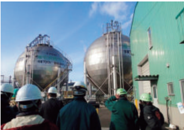
炭酸ガス液化装置の見学