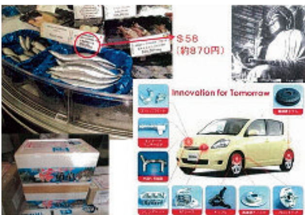
講演会の内容(鑄造と水産物の付加価値化)