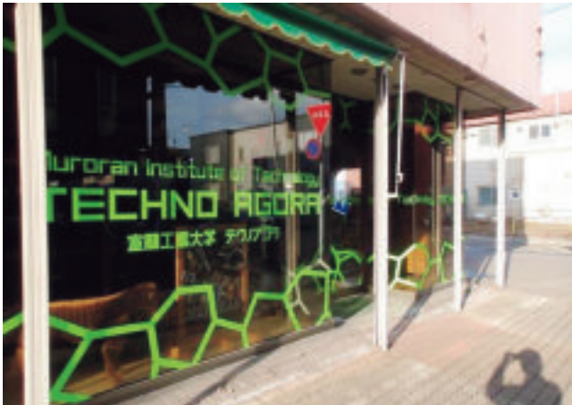
室蘭工業大学 テクノアゴラ外観

開催日：2015年(平成27年)1月16日(金) 会場：室蘭工業大学テクノアゴラ