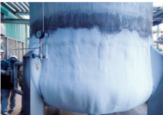
液化炭酸ガスを製造