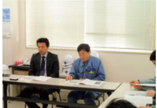
エアウォーター炭酸の説明