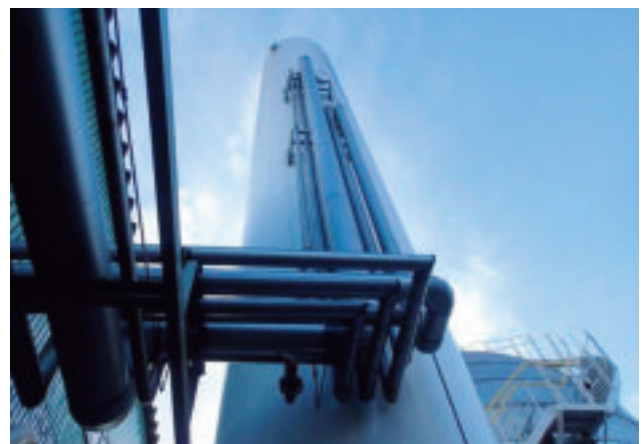
コールド BOX 施設