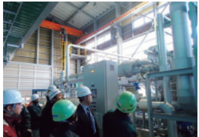
炭酸精製課程見学