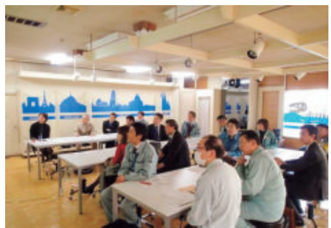
講演会での参加者