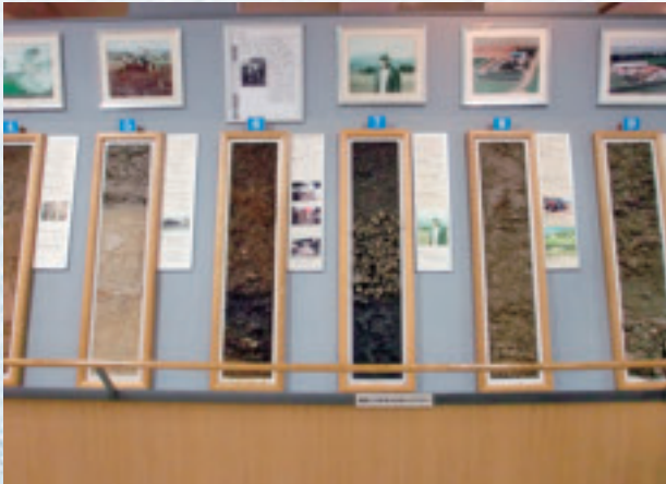
9/16 土の館：各地のモノリス(土壌標本)