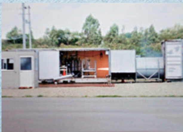
9/16 ロケットエンジン噴射実験