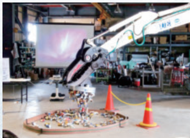
9/16 マグネットへの空き缶吸着の様子