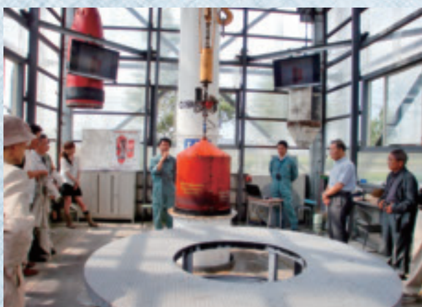
9/16 微小重力実験カプセル