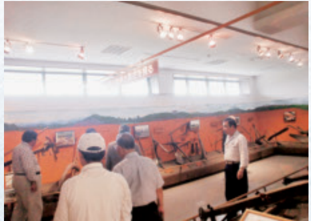
9/16 世界各国の農機具プラウの展示