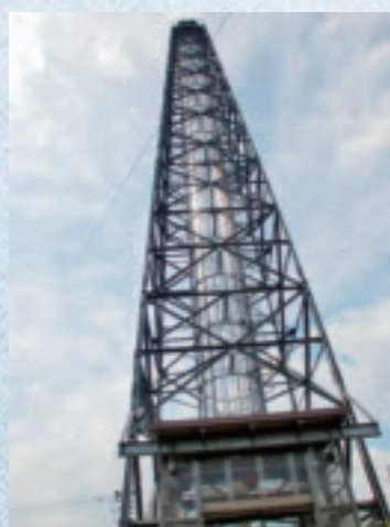
9/16 高さ57 mの 微小重力実験塔