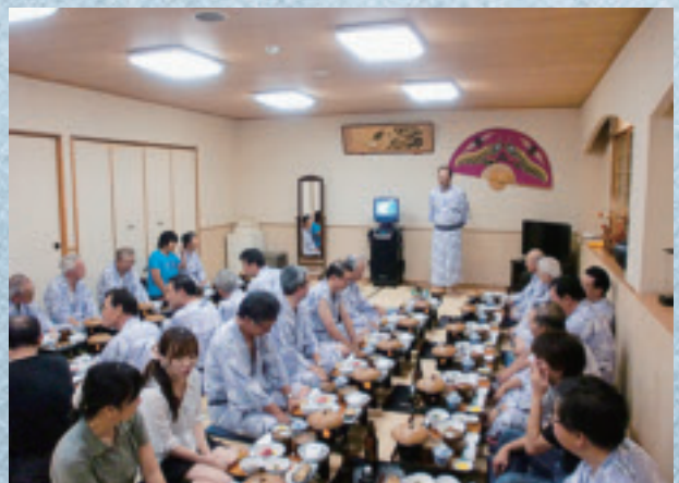
9/16 フラヌイ温泉での懇親会