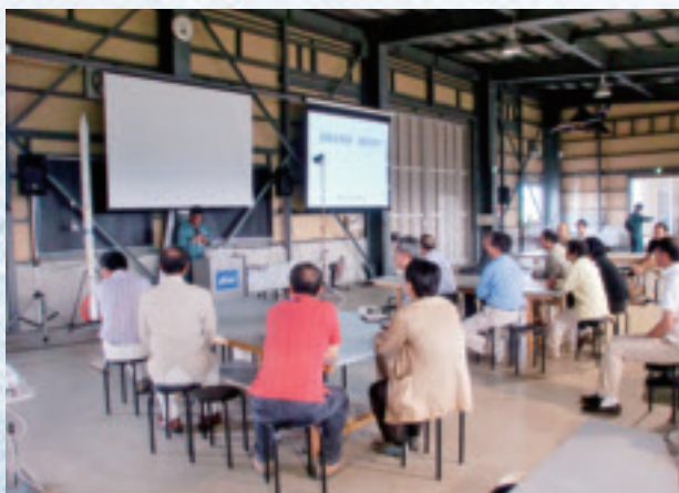
9/16 植松電機：ロケット開発等の説明