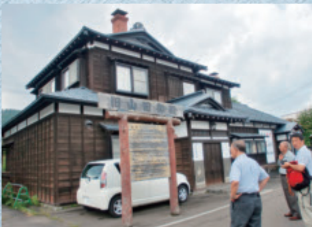
9/16 昼食会場の御殿倶楽部(旧山田御殿)