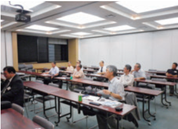
説明を聞き入る参加者