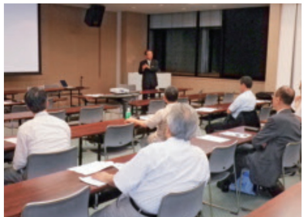
質問に答える講演者②