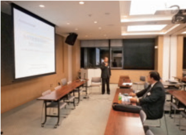
講演した豊谷技術士