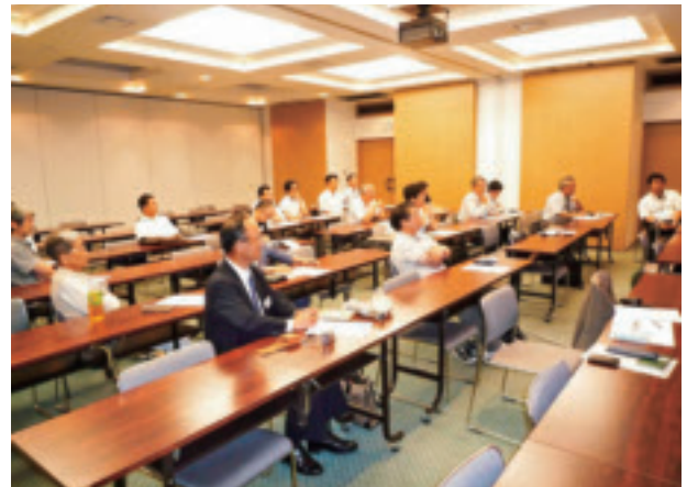
質問に答える講演者