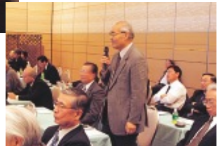
会場から活発な意見が出されました