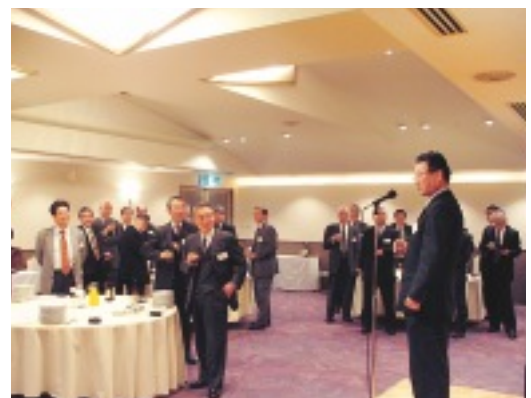
フォーラム後の交流会の様子