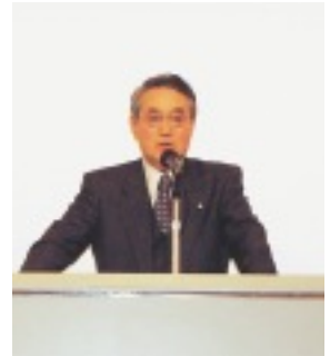
大島支部長の開会挨拶

人口減少をテーマに30年後のある自治体を想定し、壇上の発表者を行政側、参加者を町民側として意見交換を行うユニークな形式で実施しました。