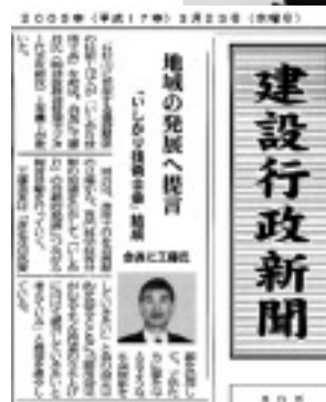
図-1 発足総会状況写真と新聞記事