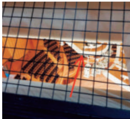
天井裏から見た景色 音響反射板の裏側が見られる