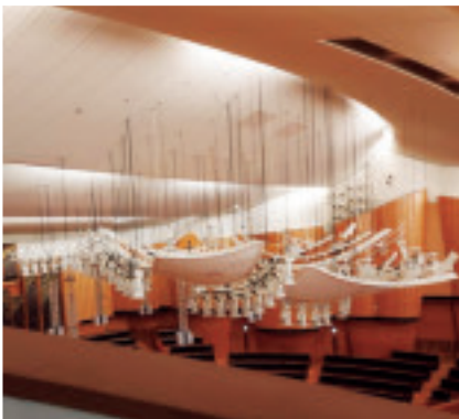
空中に浮かぶ音響反射板 ステージから発した音をホール全体に拡散させる