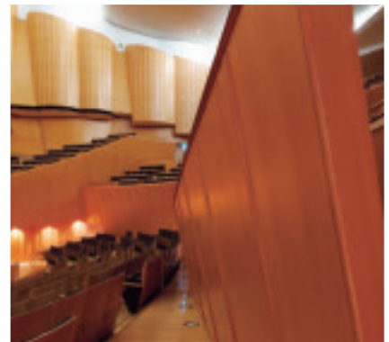
客席内倒し壁 傾斜した壁が音を程よく反射させてハリのある響きを実現する