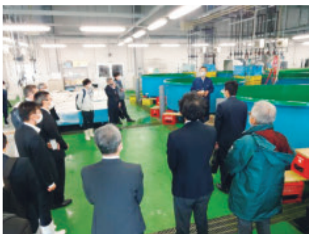
現地見学会の様子②(飼育水槽見学)