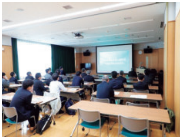
現地見学会の様子①(ビデオ視聴)