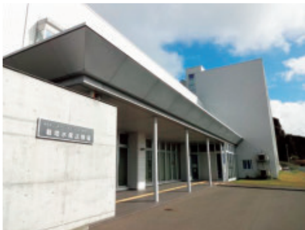
現地見学会会場(栽培水産試験場)