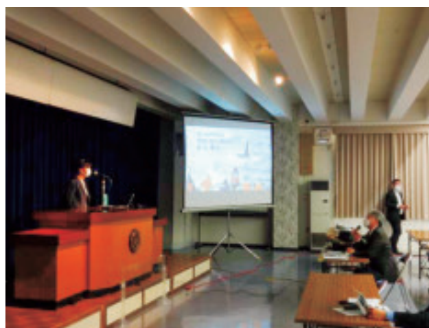
講演会の様子②(活発な質疑応答)