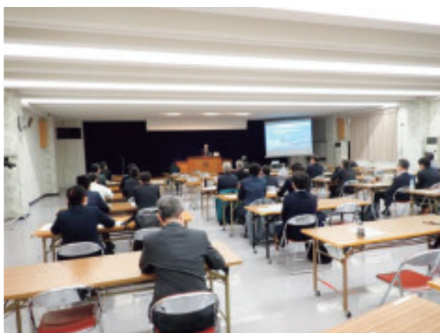
講演会の様子①(熱心に聞き入る参加者)