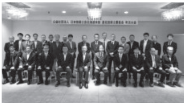
写真-1 総会・研修会参加者の集合写真

会場参集では過去2年開催できていなかったため、令和元年度からの内容も含めて活動紹介を行いました。令和4年度の事業計画としては、新型コロナウイルスの動向を見ながら、適切な時期に適切な内容で、なるべく直接コミュニケーションを採れる方式での活動を念頭に、継続研鑽や会員同士の交流の場を提供していくことを確認しました。