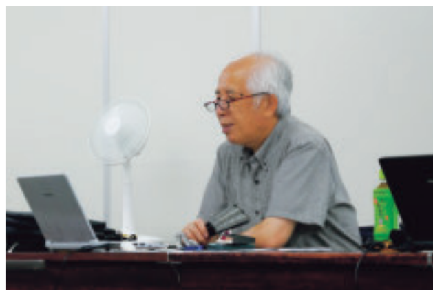
講師の朝倉康夫東京工業大学名誉教授・神戸大学名誉教授