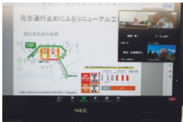
オンライン画面の一例