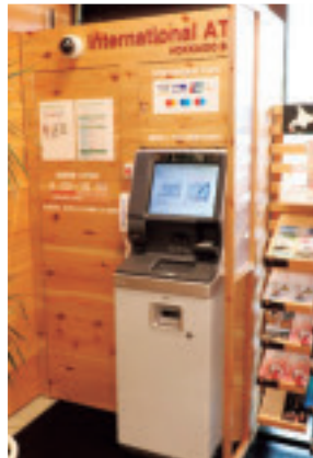
銀行 ATM (海外カード対応)