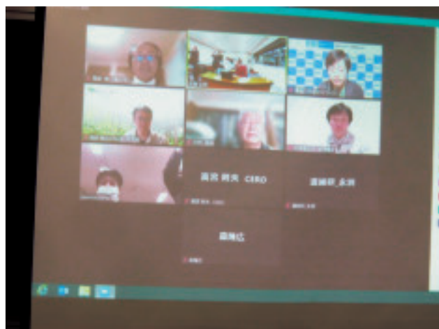
写真-5 研修会、Web参加者の画像