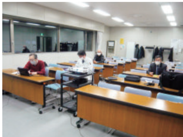
写真-4 第3回研修会、会場参加者の参加状況