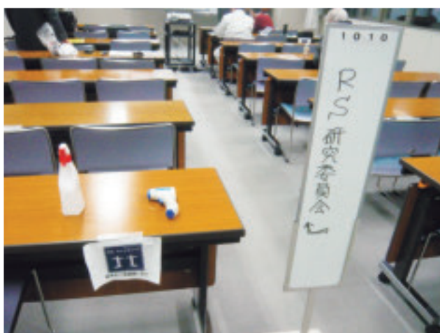
写真-3 会場に設けられた新型コロナウイルスの感染対策グッズ