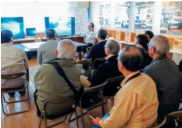
〈東峰村〉被災当時の記録・映像を示しながらの 説明を受ける