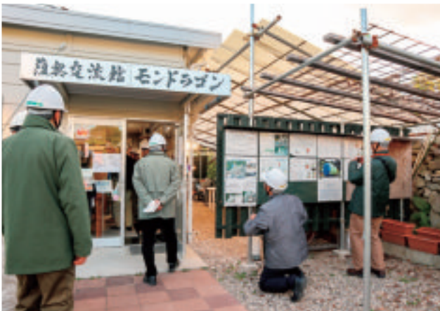
〈広島市〉「復興交流館 モンドラゴン」入り口。 工事の掲示板