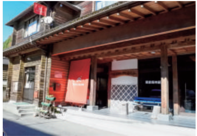
〈東峰村〉「災害伝承館」外観。 森林組合事業所の2階を活用