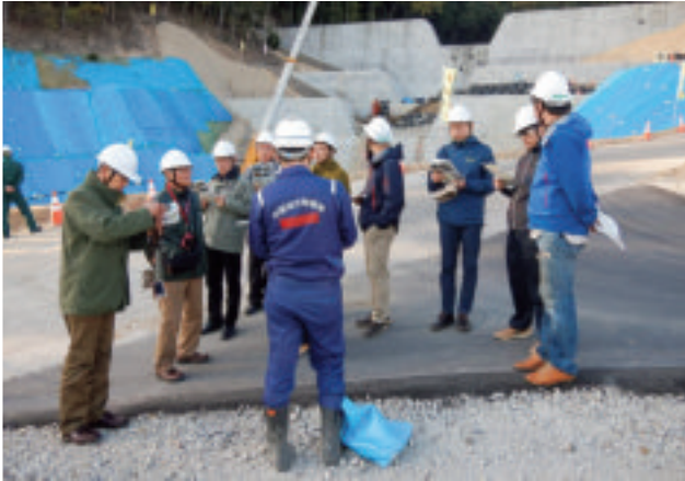
〈広島市〉 工事中の砂防堰堤(えんてい)を背景に説明を受ける