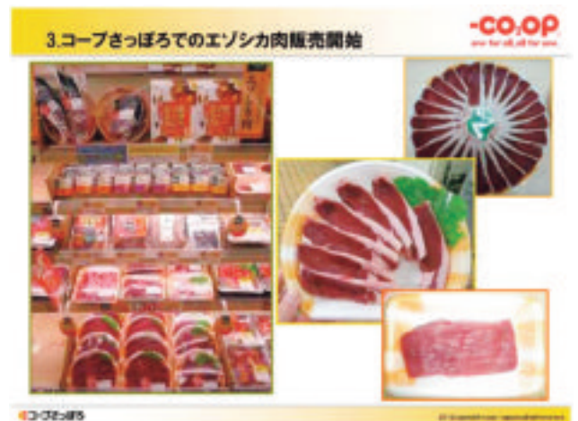
3. コープさっぽろでのエゾシカ肉販売開始