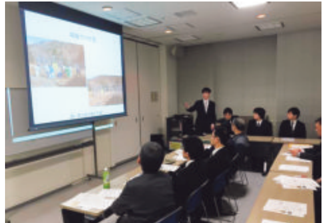
捕獲農の研究成果報告