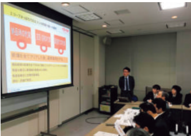
外部講師による講演会