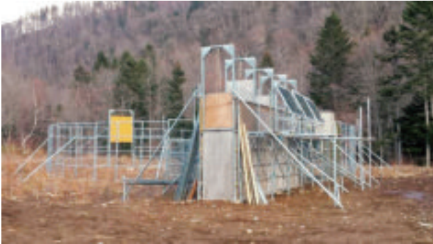
エゾシカ用 ホイッスル形囲いワナの外観

設置期間：平成 26 年 11 月～平成 27 年 3 月 設置場所：北海道斜里郡斜里町