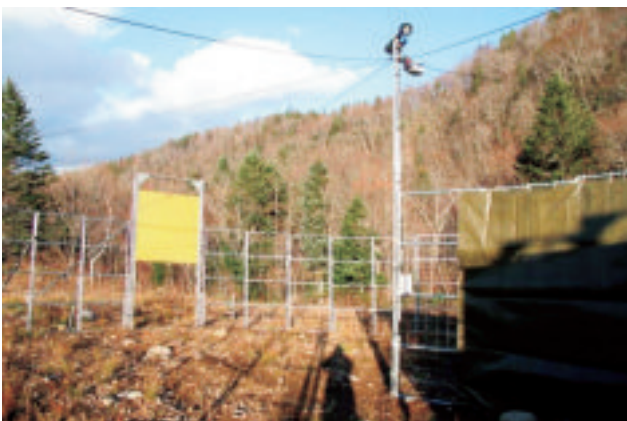
遠隔監視装置 (右上) と落とし扉 (左)