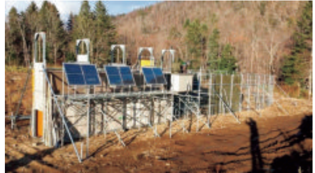
遠隔監視装置の電力を賄う太陽光電池