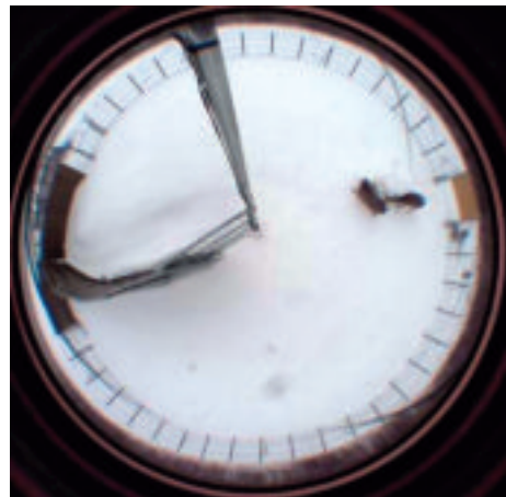
地上 5m に設置された遠隔監視装置が撮影したワナ内の日中画像 (右にエゾシカが確認できる)