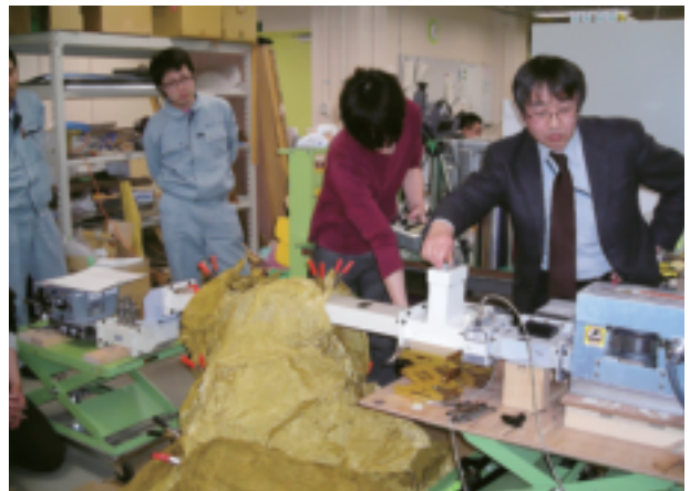
鏡教授研究室での実験