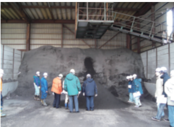
再生骨材(13～0mm)ストックヤード