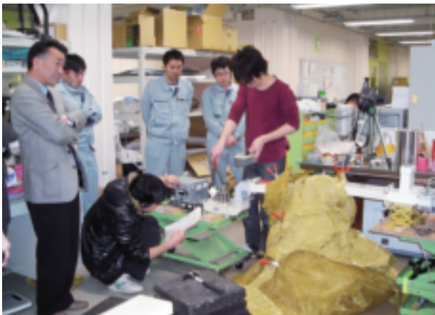
鏡教授研究室での実験