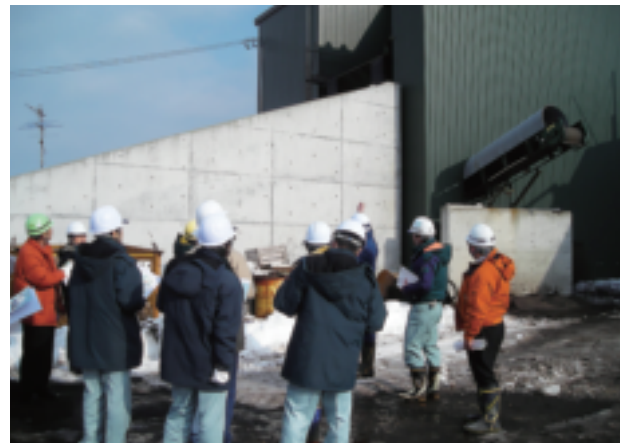
骨材ストックヤードの説明