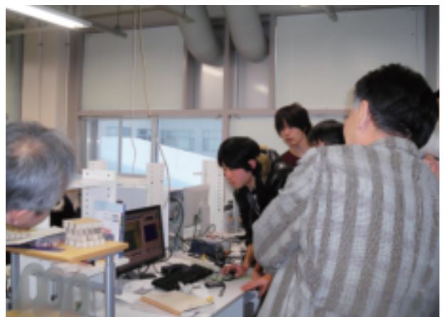
実験データの確認