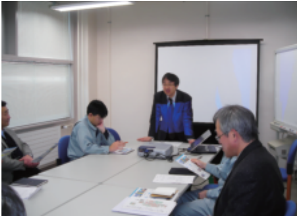
鏡教授研究室での講演