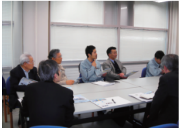
鏡教授研究室での講演